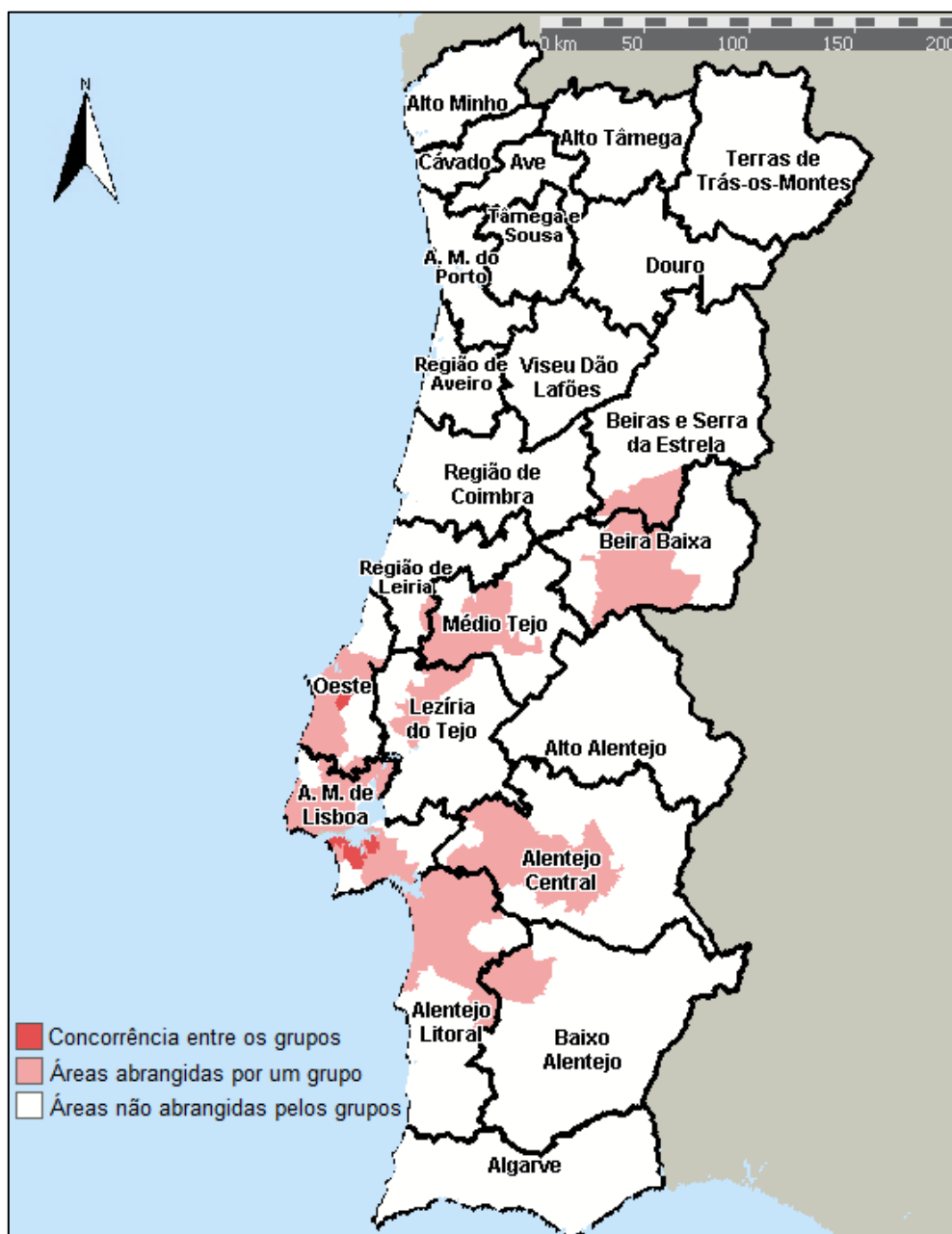
Figura 2 – Mercado geográfico relevante de serviços de MCDT de cardiologia

A figura 2 identifica as regiões onde os dois grupos atuam neste mercado, bem como, a vermelho, onde há concorrência efetiva – em pequenas regiões nas NUTS III do Oeste e da Área Metropolitana de Lisboa.